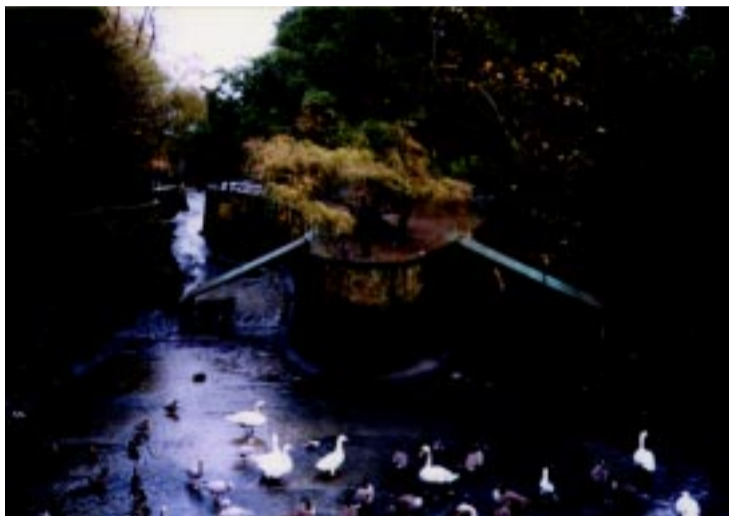
El estanque se vacía, sin retirar las aves que quedan expuestas a los lodos tóxicos. A continuación, los operarios "arrastran" con mangueras los detritus hasta el desagüe...

La indignación por esta maniobra concesionaria del equipo de gobierno municipal de Santander se hizo patente tanto entre el empresariado como en los sindicatos UGT y CCOO. Todos abogaron por dar preferencia a las empresas de la región, siempre que no suponga un sobrecoste sustancial para la administración pública. El presidente de la CEOE, Lope Carral, criticó la decisión municipal de optar por Tremesa-Piñera diciendo que «en igualdad de condiciones no se debería otorgar el servicio a una empresa foránea». En parecidos términos de acritud se pronunció Juan José Obeso, presidente de la Asociación de Promotores de Cantabria quien incluso, al calor de la indignación del momento, habló de acudir a los tribunales para impugnar el concurso ■